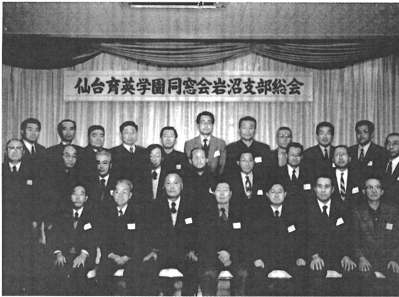
仙台育英学園同窓会岩沼支部総会